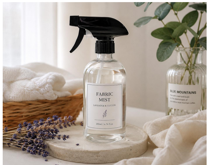
감성 섬유탈취제 만들기