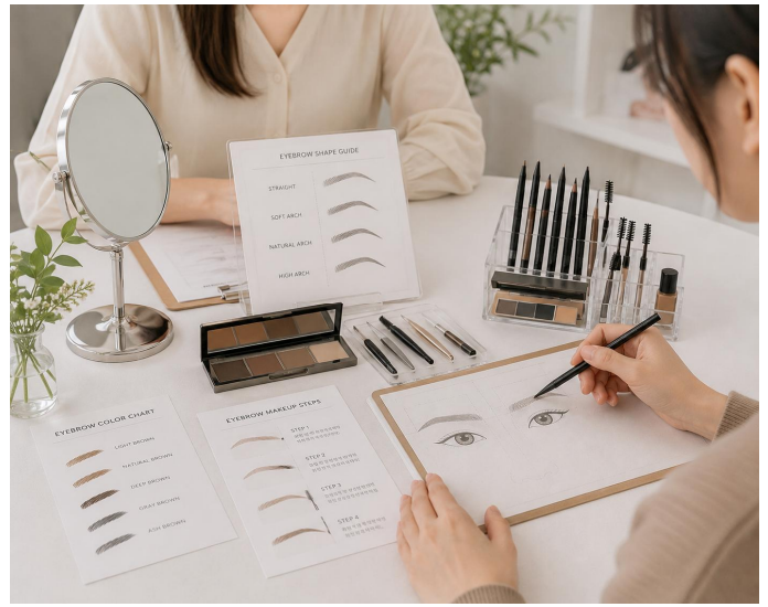
나에게 어울리는 눈썹모양 찾기