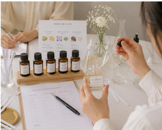
나만의 시그니처 향수 만들기