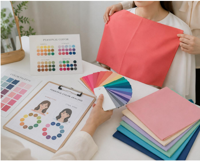
퍼스널컬러 진단 & 이미지메이킹