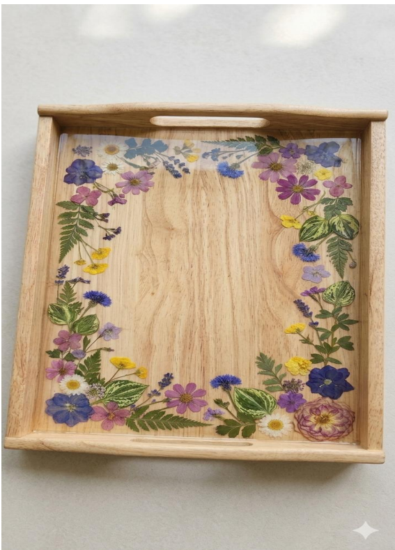
압화 쟁반 제작하기